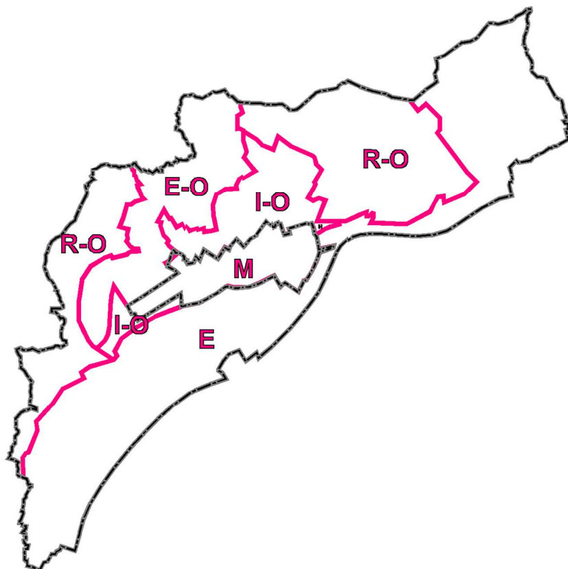
Rys. Wariantowanie struktury funkcjonalno-przestrzennej. Wariant „umiarkowany” (przyjęty jako podstawa do planowania rozwoju i zagospodarowania).

Szereg zagadnień jest niezależnych od polityki władz gminy i na etapie Studium następuje ich adaptacja w „narzuconym” stanie i przebiegu. Dotyczy to przede wszystkim: