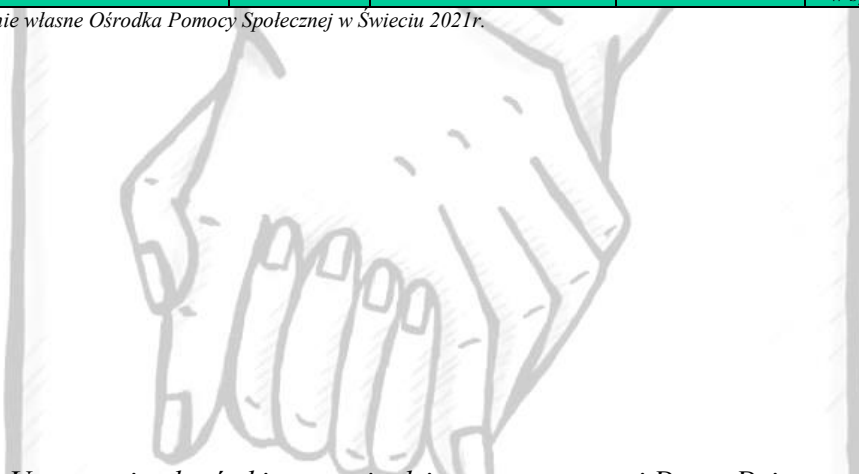
Tabela nr 6: Utworzenie placówki wsparcia dziennego w postaci Domu Dziennego dla młodzieży w celu zapewnienia poczucia bezpieczeństwa dzieciom i młodzieży mających problem z inicjacjom środków psychoaktywnych, dopalaczy, narkotyków, alkoholu i innych środków odurzających.

Źródło: opracowanie własne Ośrodka Pomocy Społecznej w Świeciu 2021r.