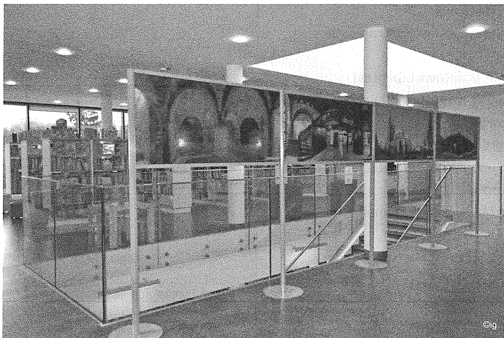
Wystawa Marka Czarneckiego „Przestrzenie Kujawsko-Pomorskie 3D”