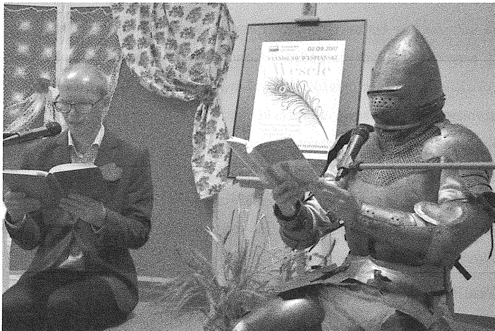
Narodowe Czytanie „Wesela” Stanisława Wyspiańskiego

Prowadzenie działalności kulturalnej i edukacyjnej promującej książki i bibliotekę w środowisku lokalnym poprzez organizację spotkań autorskich, wystaw tematycznych, konkursów czytelniczych. Działanie odpowiada na potrzebę poczucia tożsamości i wspólnoty z mieszkańcami gminy, na potrzebę samorealizacji i aktywności społecznej. Odpowiedzialny za realizację tego zadania będzie zespół pracowników biblioteki, któremu konieczne będą odpowiednie środki finansowe na zakup materiałów do organizacji wystaw, konkursów, spotkań, na honoraria dla autorów i nagrody dla uczestników konkursów. Rezultatem zadania będzie szeroka oferta działań bibliotecznych, łatwy i powszechny dostęp do szeroko rozumianej kultury i rozrywki, przede wszystkim czytelniczej.