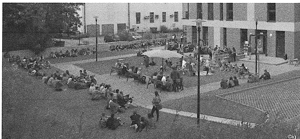
Bicie rekordu czytania w jednym momencie w Letniej Czytelni

Nowy budynek siedziby głównej biblioteki to 1009 m 2 przestrzeni zaprojektowanej przede wszystkim z myślą o użytkownikach, zarówno czytelnikach jak i pracownikach biblioteki: na parterze mieści się wypożyczalnia dla dorosłych, czytelnia i dział gromadzenia i opracowania zbiorów, na piętrze znajduje się oddział dla dzieci z miejscem do zabaw, sala konferencyjna i pomieszczenia administracyjne. Biblioteka, oprócz tradycyjnych zbiorów, oferuje też dostęp do internetu, możliwość skorzystania z komputerów, drukarek kserokopiarek, a także letnią czytelnię z leżakami i stolikami, mieszczącą się na tyłach budynku na terenie zielonym należącym do biblioteki. Budynek jest dostosowany do potrzeb osób niepełnosprawnych (podjazd dla wózków, winda, toalety dla niepełnosprawnych) i wyposażony w system monitoringu i system alarmowy. Biblioteka dysponuje 30 miejscami parkingowymi wykorzystywanymi zarówno przez użytkowników biblioteki, jak i mieszkańców Świecia czy osoby przyjezdne.