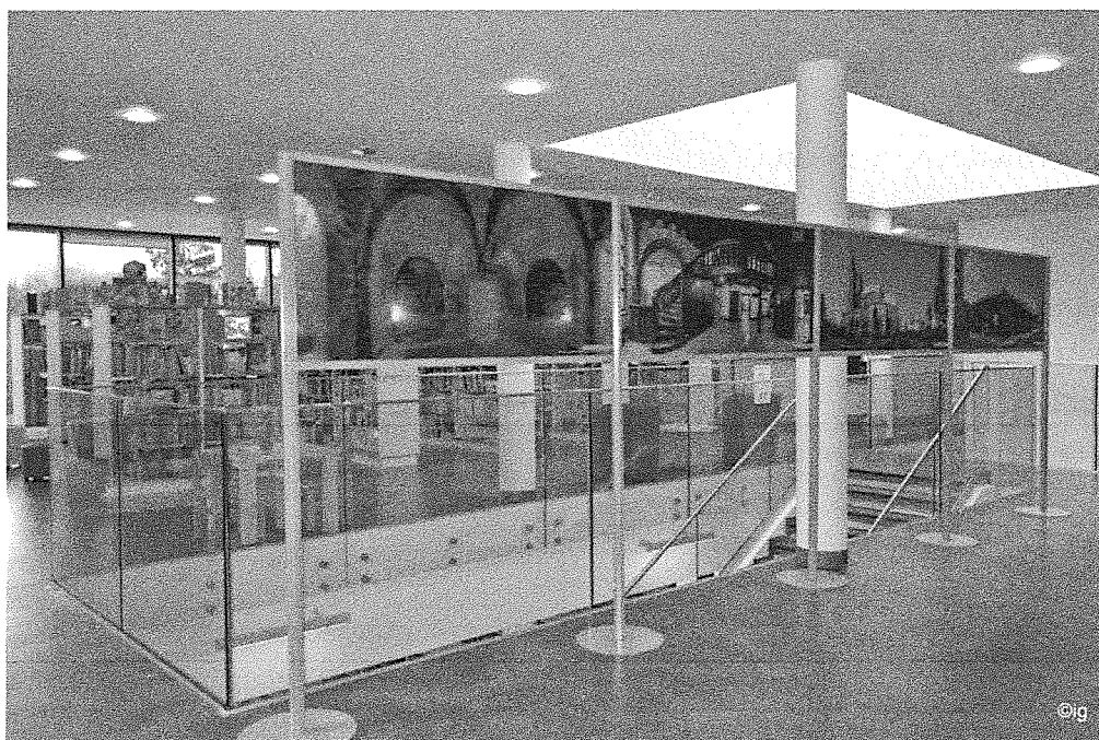
Wystawa Marka Czarneckiego „Przestrzenie Kujawsko-Pomorskie 3D”