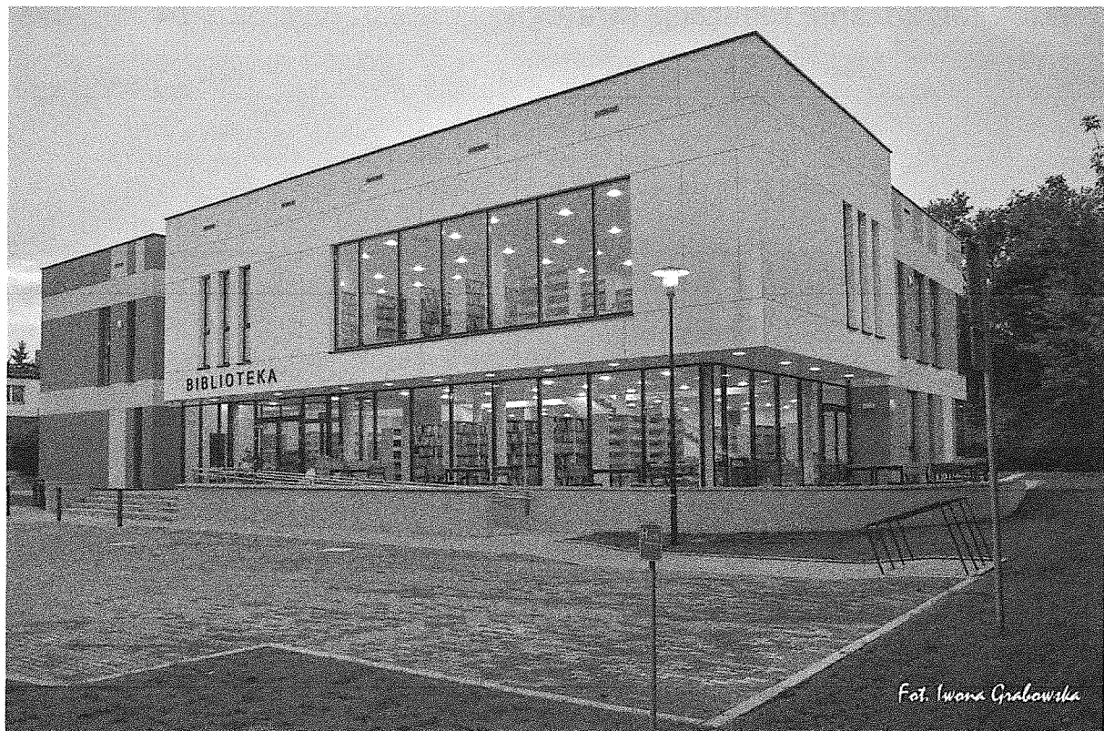
siedziba główna Miejskiej Biblioteki Publicznej w Świeciu