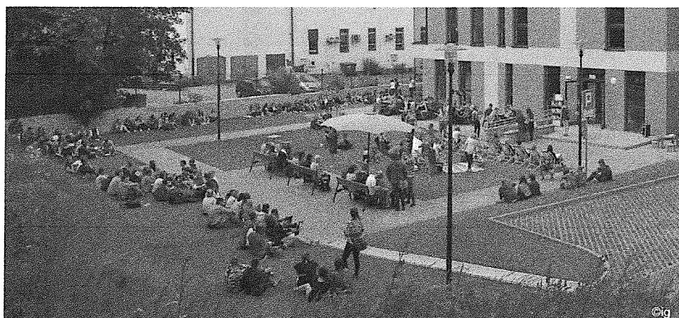
Bicie rekordu czytania w jednym momencie w Letniej Czytelni

Nowy budynek siedziby głównej biblioteki to 1009 m 2 przestrzeni zaprojektowanej przede wszystkim z myślą o użytkownikach, zarówno czytelnikach, jak i pracownikach biblioteki: na parterze mieści się wypożyczalnia dla dorosłych, czytelnia i dział gromadzenia i opracowania zbiorów, na piętrze znajduje się oddział dla dzieci z miejscem do zabaw, sala konferencyjna i pomieszczenia administracyjne. Biblioteka, oprócz tradycyjnych zbiorów, oferuje też dostęp do internetu, możliwość skorzystania z komputerów, drukarek, kserokopiarek, a także letnią czytelnię z leżakami i stolikami, mieszczącą się na tyłach budynku na terenie zielonym należącym do biblioteki. Budynek jest dostosowany do potrzeb osób niepełnosprawnych (podjazd dla wózków, winda, toalety dla niepełnosprawnych) i wyposażony w system monitoringu i system alarmowy. Biblioteka dysponuje 30 miejscami parkingowymi wykorzystywanymi zarówno przez użytkowników biblioteki, jak i mieszkańców Świecia czy osoby przyjezdne.