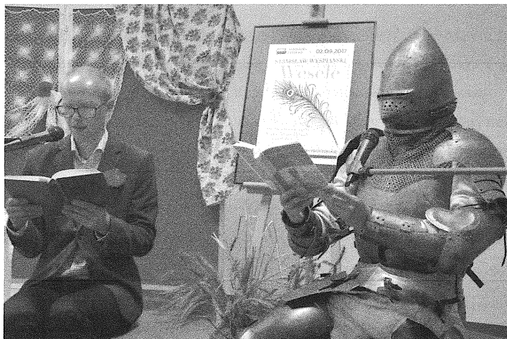
Narodowe Czytanie „Wesela” Stanisława Wyspiańskiego

Prowadzenie działalności kulturalnej i edukacyjnej promującej książki i bibliotekę w środowisku lokalnym poprzez organizację spotkań autorskich, wystaw tematycznych, konkursów czytelniczych. Działanie odpowiada na potrzebę poczucia tożsamości i wspólnoty z mieszkańcami gminy, na potrzebę samorealizacji i aktywności społecznej. Odpowiedzialny za realizację tego zadania będzie zespół pracowników biblioteki, któremu konieczne będą odpowiednie środki finansowe na zakup materiałów do organizacji wystaw, konkursów, spotkań, na honoraria dla autorów i nagrody dla uczestników konkursów. Rezultatem zadania będzie szeroka oferta działań bibliotecznych, łatwy i powszechny dostęp do szeroko rozumianej kultury i rozrywki, przede wszystkim czytelniczej.