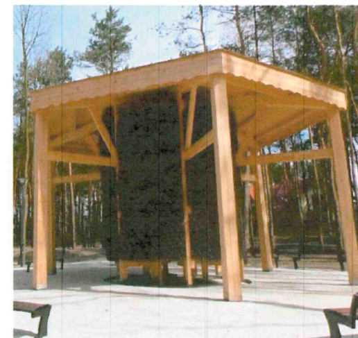
Przykładowe zdjęcie tężni solankowej