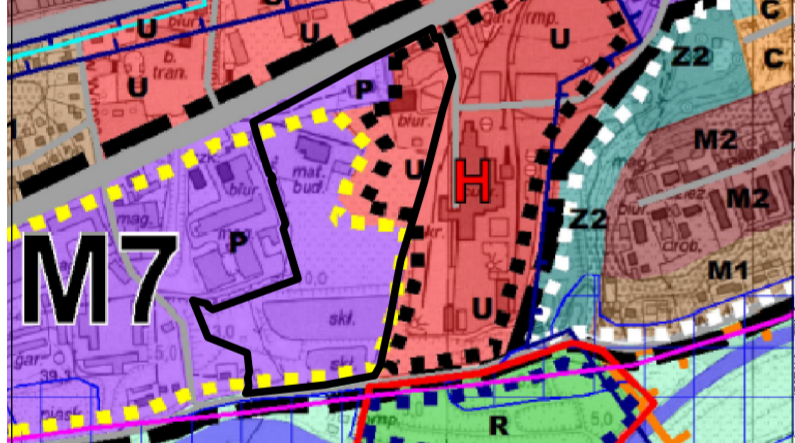
Studium Uwarunkowań i Kierunków Zagospodarowania Przestrzennego Gminy Świecie Skala 1:10 000