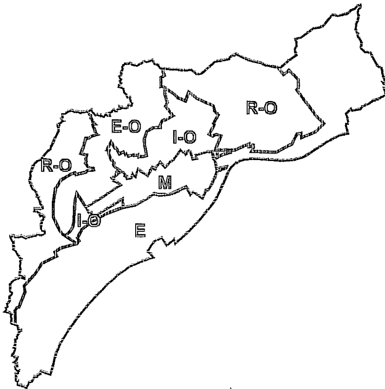
Rys. Wariantowanie struktury funkcjonalno-przestrzennej. Wariant „umiarkowany” (przyjęty jako podstawa do planowania rozwoju i zagospodarowania).

Szereg zagadnień jest niezależnych od polityki władz gminy i na etapie Studium następuje ich adaptacja w „narzuconym” stanie i przebiegu. Dotyczy to przede wszystkim: