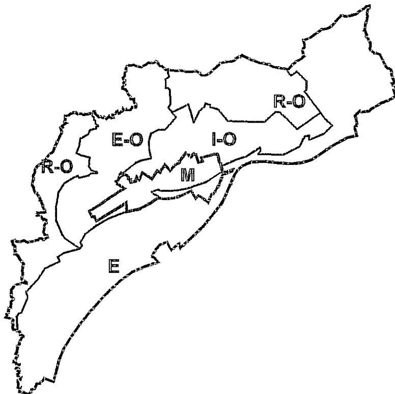
Rys. Wariantowanie struktury funkcjonalno-przestrzennej. Wariant „agresywny” (odrzucony).

Przedmiotem szczegółowych analiz były dwa warianty podziału gminy na jednostki planistyczne - podstawowa różnica pomiędzy wariantami polegała na skali planowanego zagospodarowania o funkcjach mieszkaniowych i gospodarczych. Warianty te przedstawiono poniżej na schematycznych załącznikach graficznych. W wyniku przeprowadzonych analiz i konsultacji, zdecydowano na wybór wariantu o mniejszej skali inwestycji (pozostawiającego większą część gminy w dotychczasowym użytkowaniu rolniczo-osadniczym, w miejsce rozważanego rozwoju zagospodarowania mieszkaniowego i gospodarczego). U podstaw wyboru leżała zarówno prognoza demograficzna, jak i dążenie do ograniczania zagospodarowania ponad rzeczywiste potrzeby w przewidywanej przyszłości.